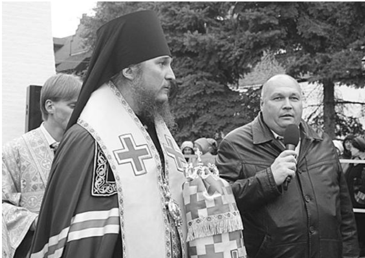
В праздник Покрова Пресвятой Богородицы, 14 октября, в Энгельсе состоялся традиционный крестный ход, который прошел по центральным улицам города.