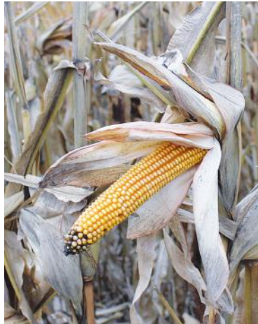
урожаю не получилось, несмотря на двойную обработку от вредителей. Пришлось отказаться от этой культуры", - рассказывает Григорий Ботов.